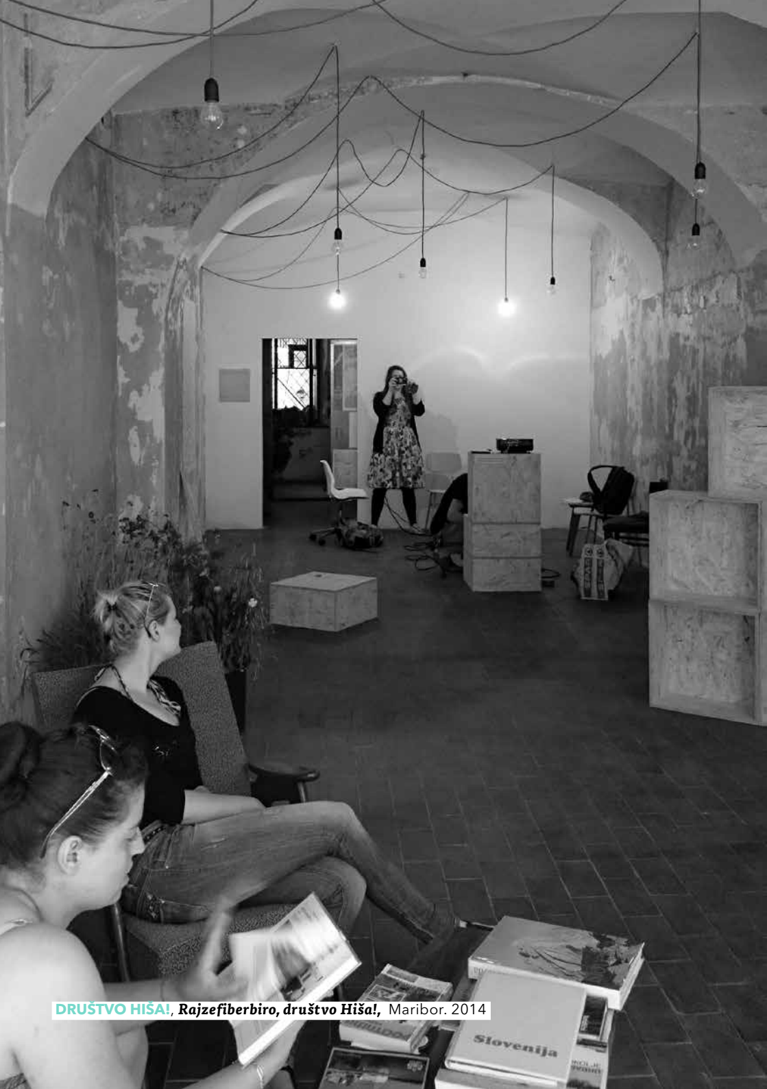
DRUŠTVO HIŠA! , Rajzefiberbiro, društvo Hiša! , Maribor. 2014